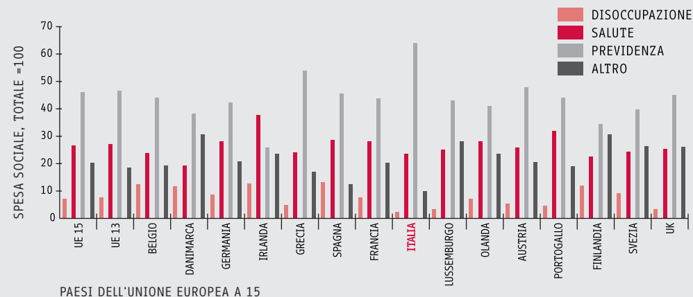
Graf. 2: spesa per le diverse voci di protezione sociale, confronto 1997 – 2006, in % di PIL.